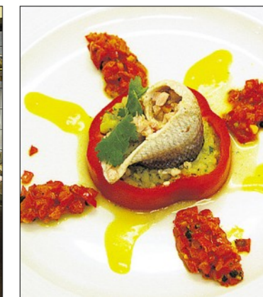
...für seine Vorspeise. Das Gericht mit Felchen präsentiert er seinen Gästen so fantasievoll angerichtet.