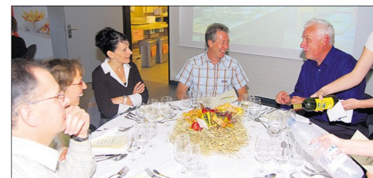
Fast wie im richtigen Restaurant: Gespannt warten die Gäste – erfahrene Köche und andere Gastroprofis, Lehrmeister, Angehörige, Sponsoren, auf den ersten Gang der Lernenden, welche diese bald schicken werden.