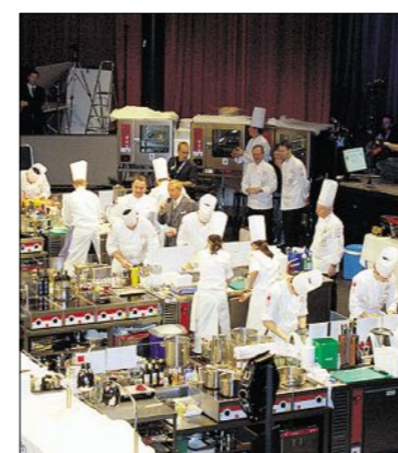
Die sechs Finalisten hatten fünf Stunden Zeit, um ihre Gerichte vor Jury und Gästen zuzubereiten.