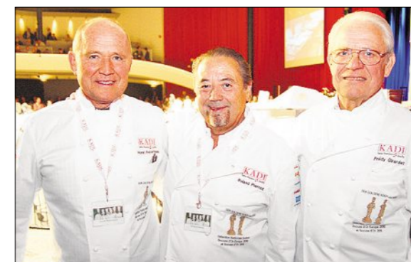
Drei Mitglieder der hochkarätigen Kochjury in Bern: Horst Petermann, Roland Pierroz und Frédy Girardet.