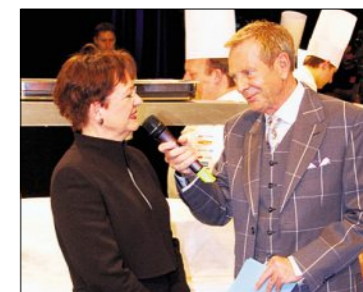
Bundeskanslerin Corina Casanova, welche die Grüsse des Bundesrats überbrachte, mit Kurt Aeschbacher.