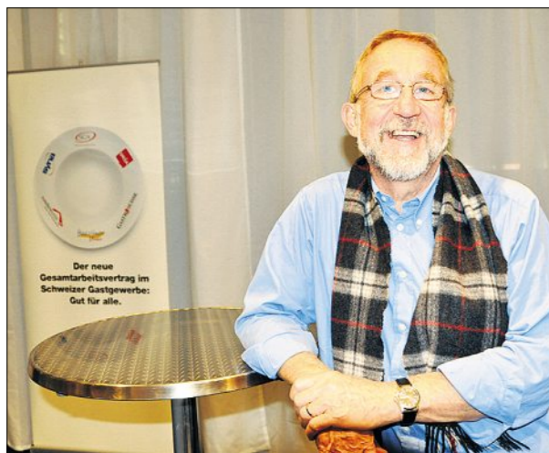
Georges Knecht hat gut lachen. Der ehemalige Präsident des Schweizer Kochverbandes ist erstmals als neu gewählter Präsident der Hotel & Gastro Union an der Igeho und freut sich über den neuen Gesamtarbeitsvertrag.