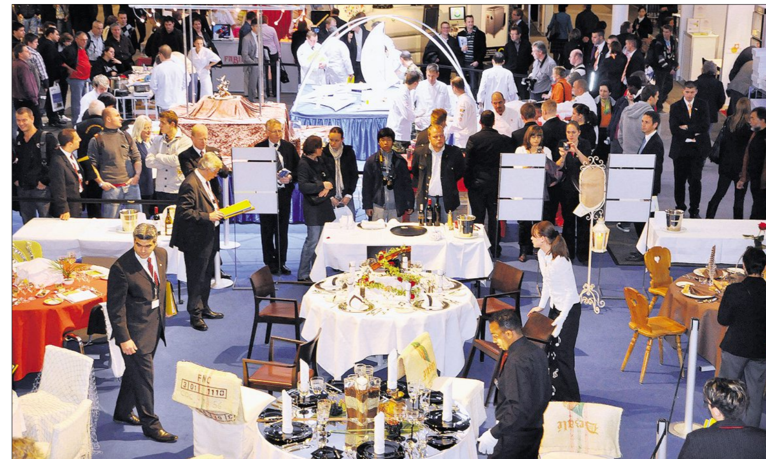
Am Stand der Hotel & Gastro Union: Permanente Action den ganzen Tag, einerseits an der Internationalen Servicemeisterschaft des Berufsverbandes Restauration, andererseits in der Galerie der Kochkunst des Schweizer Kochverbandes, bei der gerade die Regionalmannschaft Nordrhein-Westfalen und die Schweizer Armeeköche ausstellen.