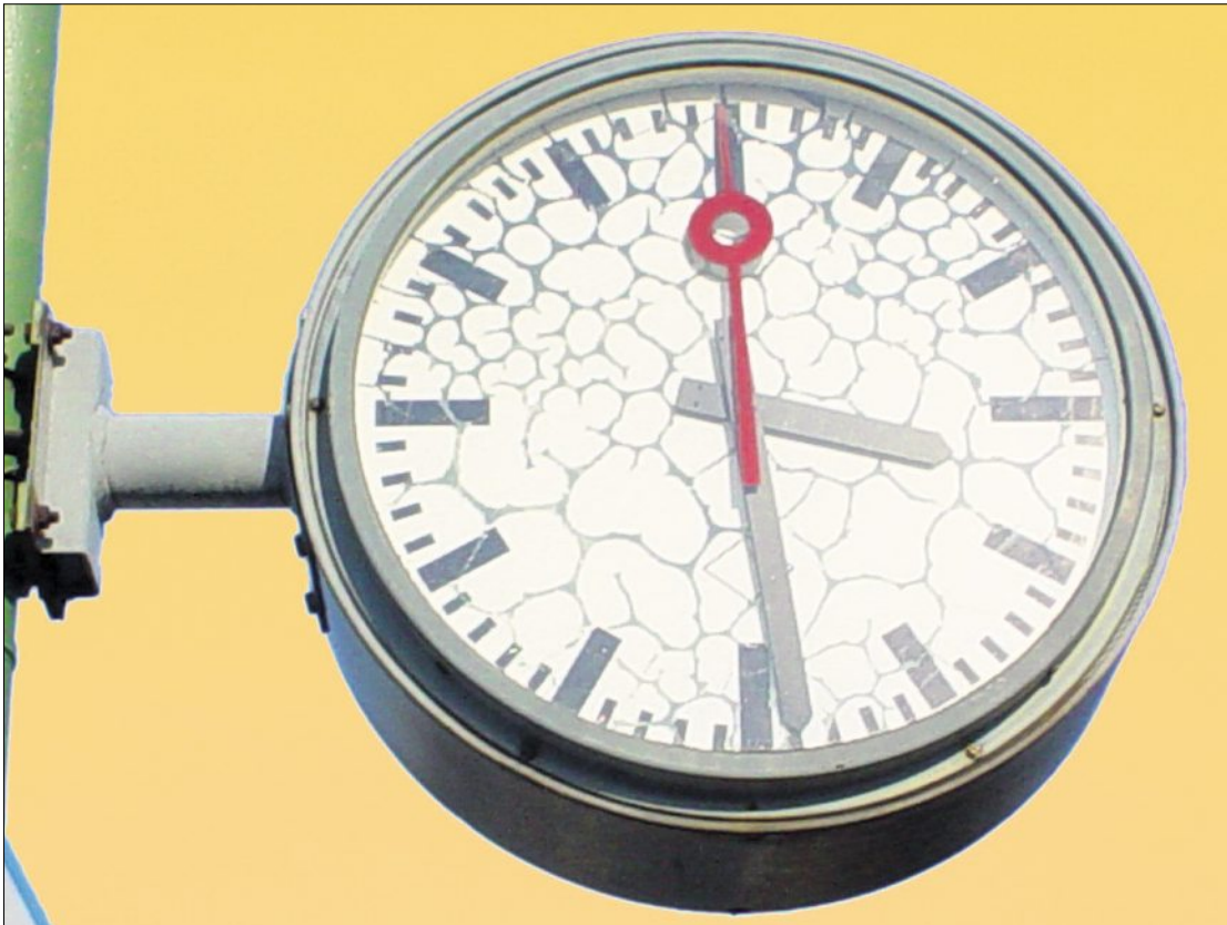
«Ein guter Gastgewerbler schaut nicht auf die Uhr», ist ein oft gehörter Satz in unserer Branche. Doch die Arbeitszeit ist im Landes-Gesamtarbeitsvertrag geregelt und ist somit für alle verpflichtend.